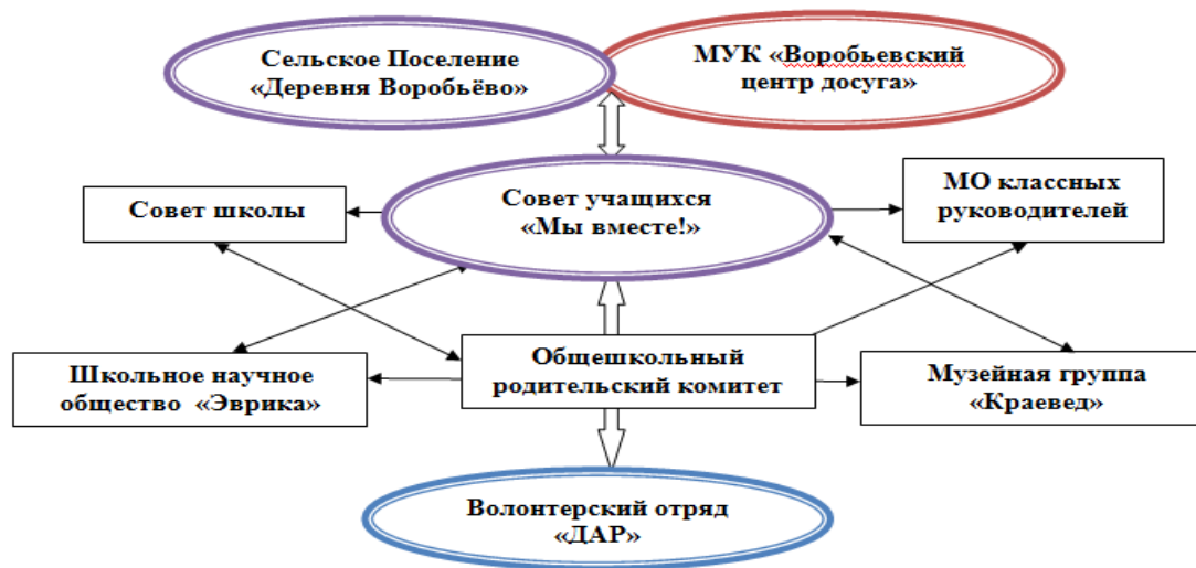
Структура взаимодействия Совета учащихся «Мы вместе» и волонтерского отряда «ДАР»